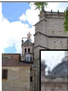
Formato: JPEG (calidad baja) Resolución: 250 x 334 pixels Tamaño: 26 KB