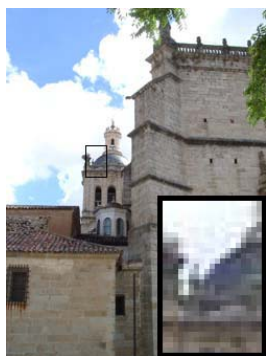
Formato: TIFF (LZW) Resolución: 250 x 334 pixels Tamaño: 171 KB

A continuación se incluye un ejemplo en el que podrá verse el efecto de la compresión con pérdidas y la variación de este último (el efecto) en función de la calidad (y, por tanto, del nivel de pérdidas).