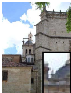
Formato: JPEG (calidad alta) Resolución: 250 x 334 pixels Tamaño: 38 KB