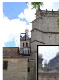
Formato: JPEG (calidad media) Resolución: 250 x 334 pixels Tamaño: 30 KB