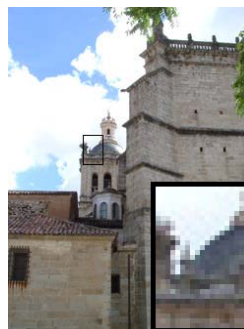
Formato: JPEG (calidad máxima) Resolución: 250 x 334 pixels Tamaño: 53 KB